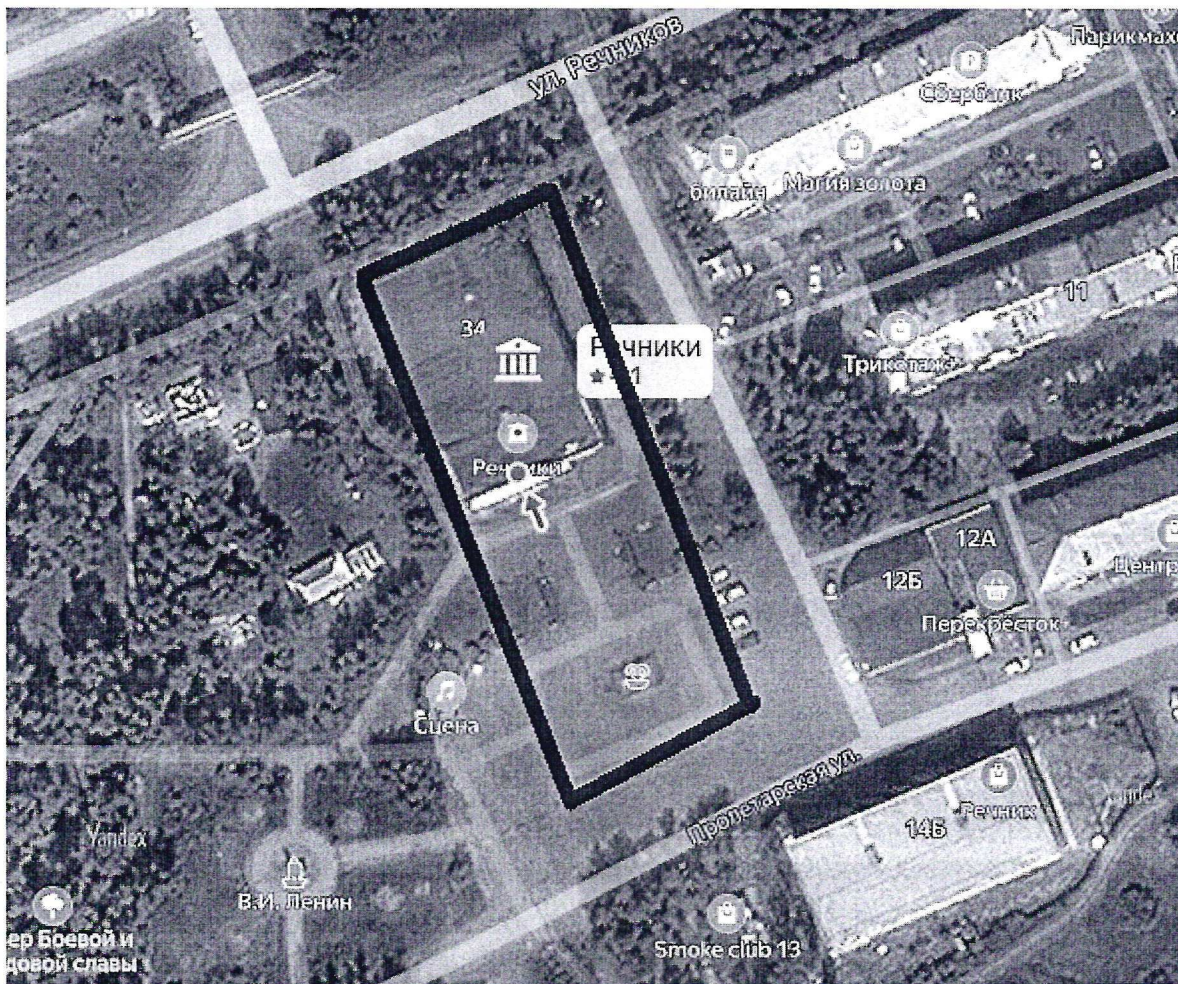
Схема границ территории проведения праздничного мероприятия на площади МБУК «ДК Речники» УКМО (гп)

Условные обозначения: _____ граница праздничного мероприятия