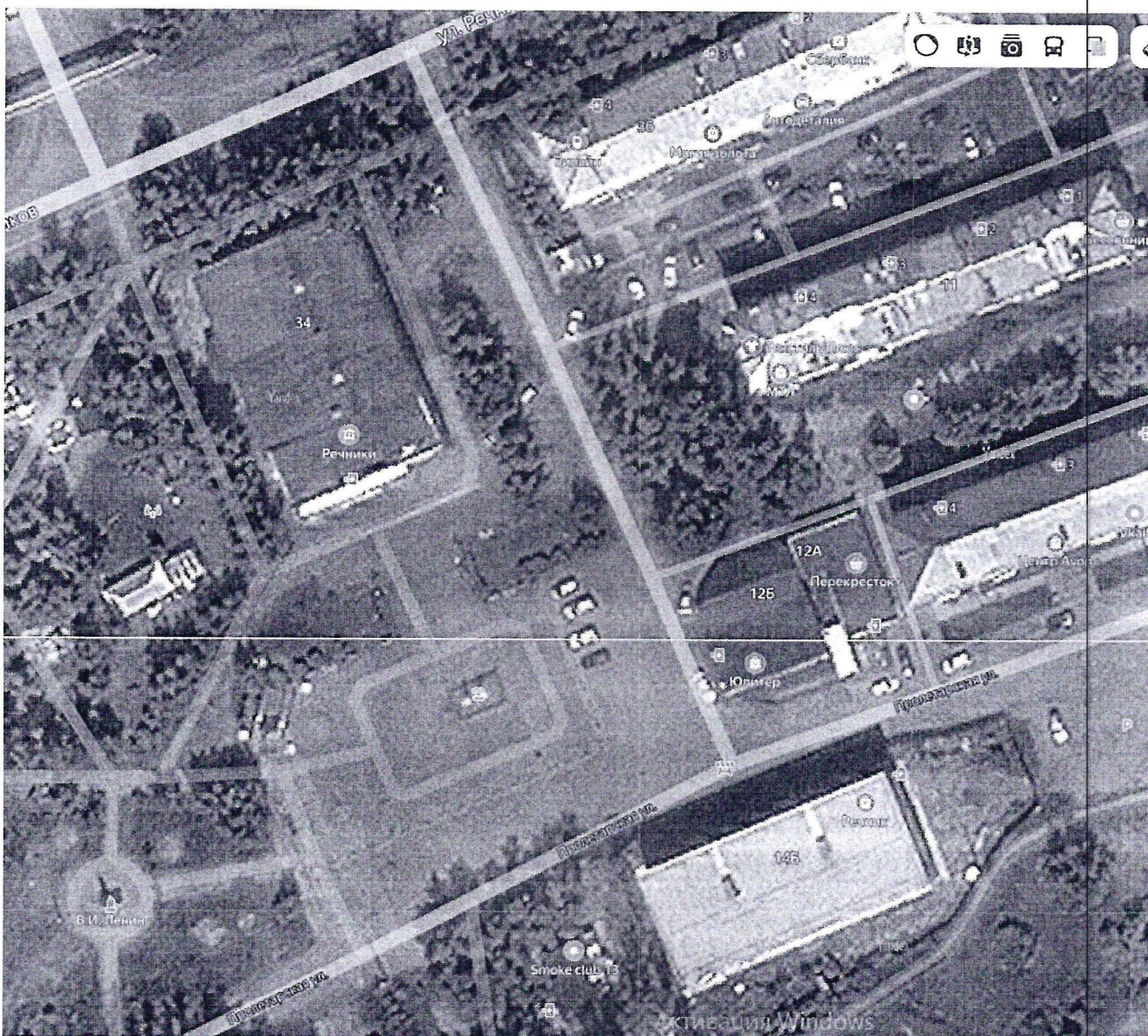
Схема закрытия движения автотранспортных средств во время проведения праздничных мероприятий с 19-00 до 21-00 часов 09.05.2024 года на площади напротив здания МБУК «ДК Речники» УКМО (гп) в городе Усть-Куте

Примечание: – места закрытия движения автотранспорта