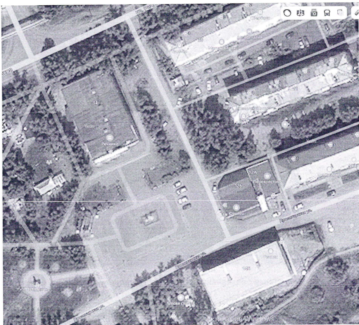
Схема Схема закрытия движения автотранспортных средств во время проведения праздничных мероприятий с 19.00 до 20.00 часов 26.06.2024 года на площади напротив здания МБУК «ДК Речники» УКМО (гп) в городе Усть-Куте

Примечание: – места закрытия движения автотранспорта