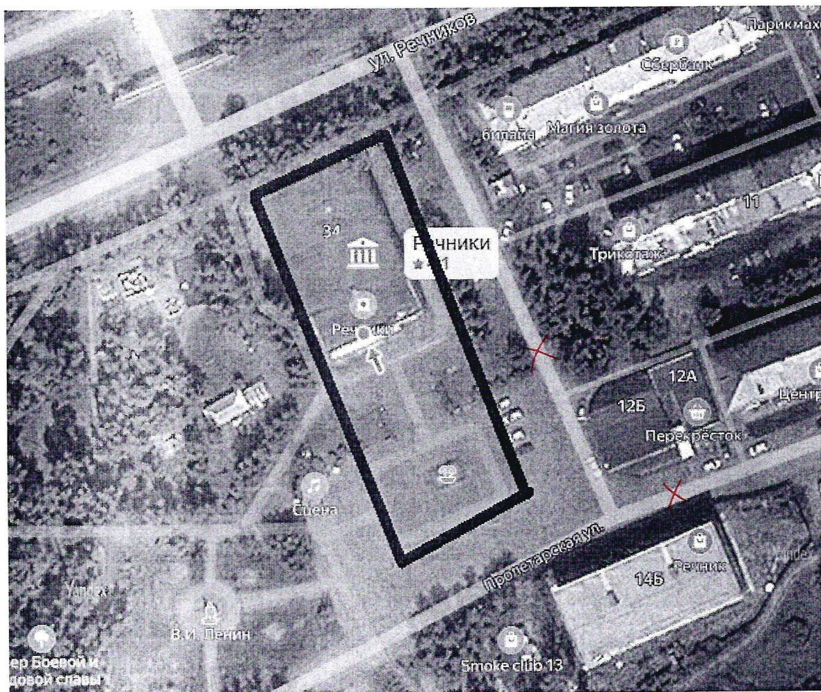
Схема закрытия движения автотранспортных средств во время проведения праздничных мероприятий с 13-00 до 15-00 часов 25.02.2022 года на площади напротив здания МБУК «ДК Речники» УКМО (гп) в городе Усть-Куте

Примечание: X – места закрытия движения автотранспорта