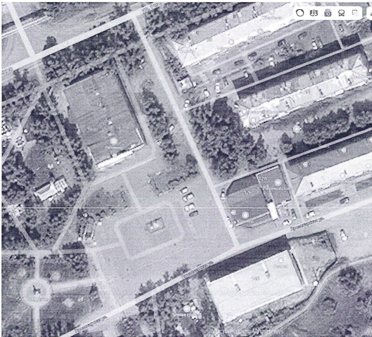
Схема Схема закрытия движения автотранспортных средств во время проведения праздничных мероприятий с 19.00 до 21.00 часов 12.06.2024 года на площади напротив здания МБУК «ДК Речники» УКМО (гп) в городе Усть-Куте

Примечание: – места закрытия движения автотранспорта