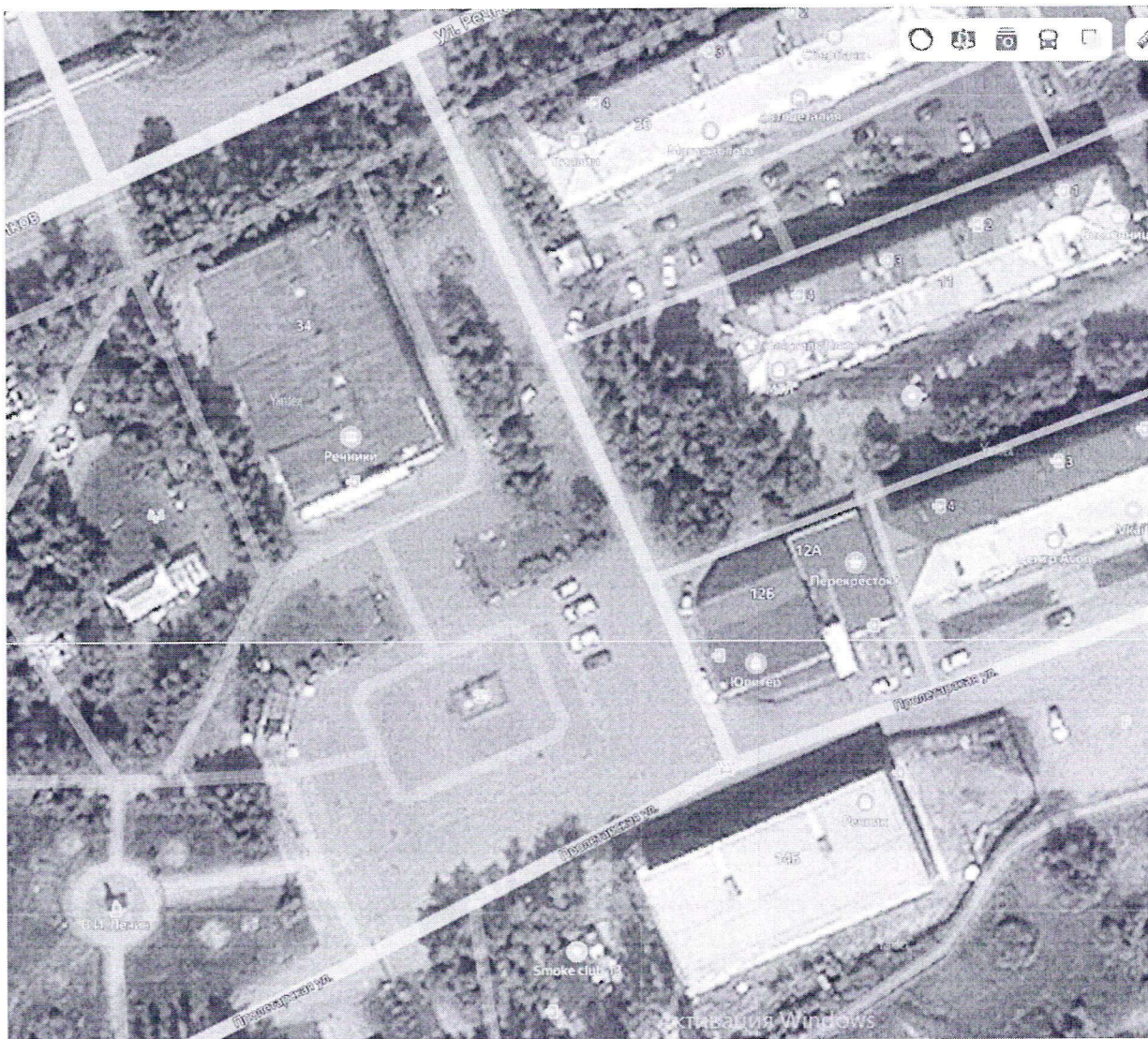
Схема закрытия движения автотранспортных средств во время проведения праздничных мероприятий с 13-00 до 15-00 часов 02.06.2024 года на площади напротив здания МБУК «ДК Речники» УКМО (гп) в городе Усть-Куте

Примечание: – места закрытия движения автотранспорта