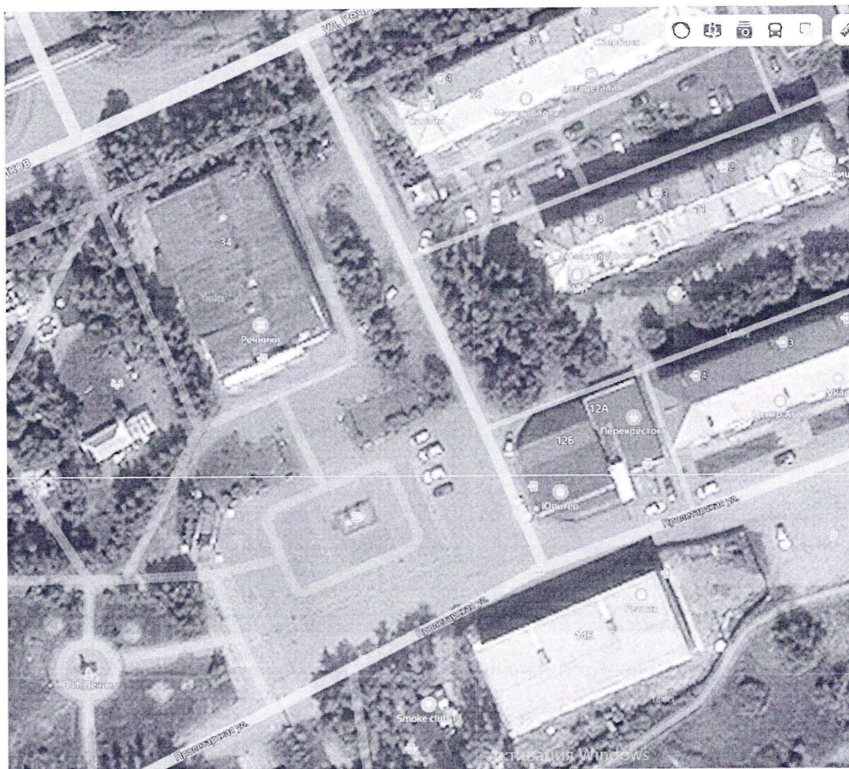
Схема закрытия движения автотранспортных средств во время проведения праздничных мероприятий с 14-00 до 20-30 часов 01.06.2024 года на площади напротив здания МБУК «ДК Речники» УКМО (гп) в городе Усть-Куте

Примечание: – места закрытия движения автотранспорта