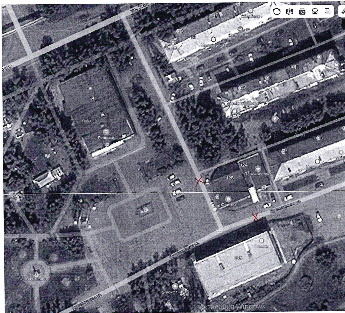
Схема закрытия движения автотранспортных средств во время проведения праздничных мероприятий с 18-00 до 19-00 часов 24.05.2022 года на площади напротив здания МБУК «ДК Речники» УКМО (гп) в городе Усть-Куте

Примечание: X – места закрытия движения автотранспорта