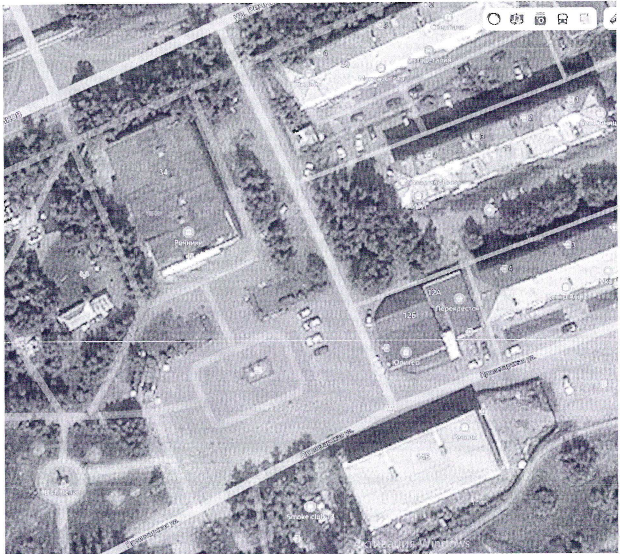
Схема закрытия движения автотранспортных средств во время проведения праздничных мероприятий с 18.00 до 20.00 часов 23.06.2024 года на площади напротив здания МБУК «ДК Речники» УКМО (гп) в городе Усть-Куте

Примечание: – места закрытия движения автотранспорта