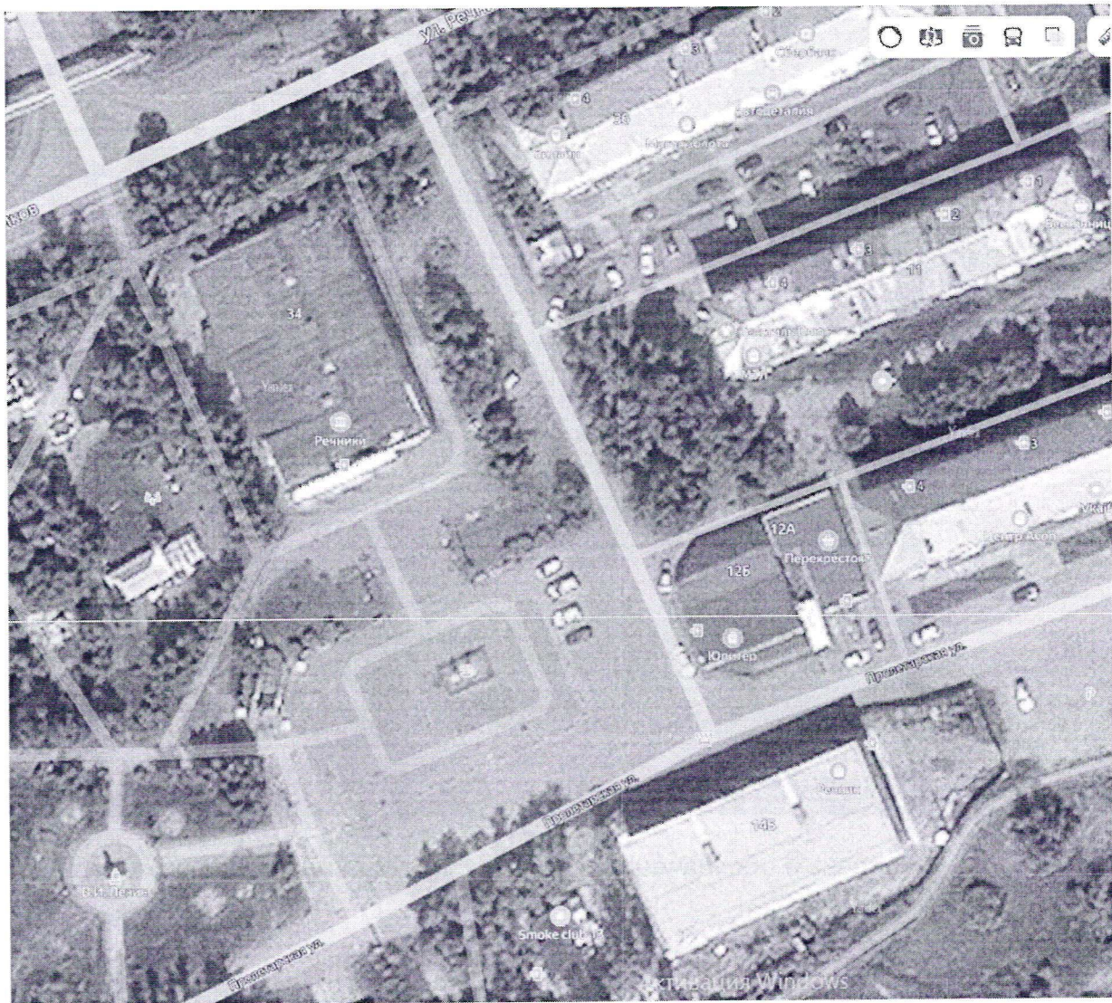
Схема Схема закрытия движения автотранспортных средств во время проведения праздничных мероприятий с 11.00 до 13.00 часов 07.07.2024 года на площади напротив здания МБУК «ДК Речники» УКМО (гп) в городе Усть-Куте

Примечание: – места закрытия движения автотранспорта