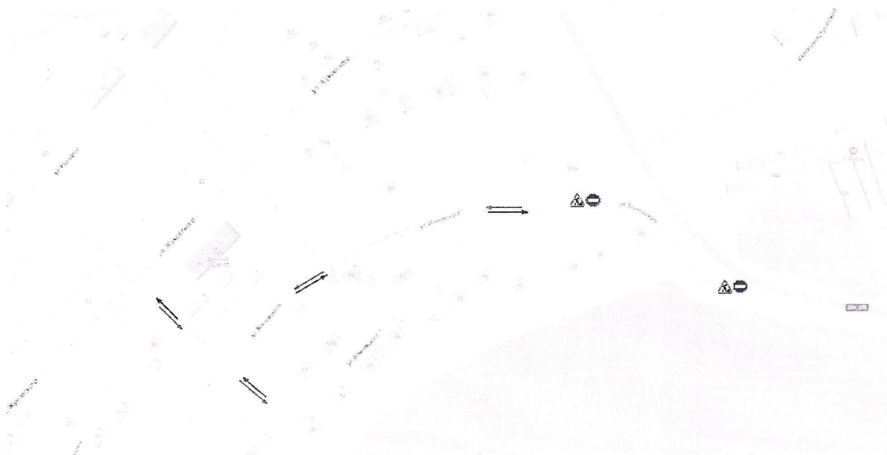
Схема организации дорожного движения по участку автомобильной дороги местного значения по улице Маяковского

Приложение №1 к постановлению администрации Усть-Кутского муниципального образования (городского поселения) от «16» июня 2023г. № 1508-П