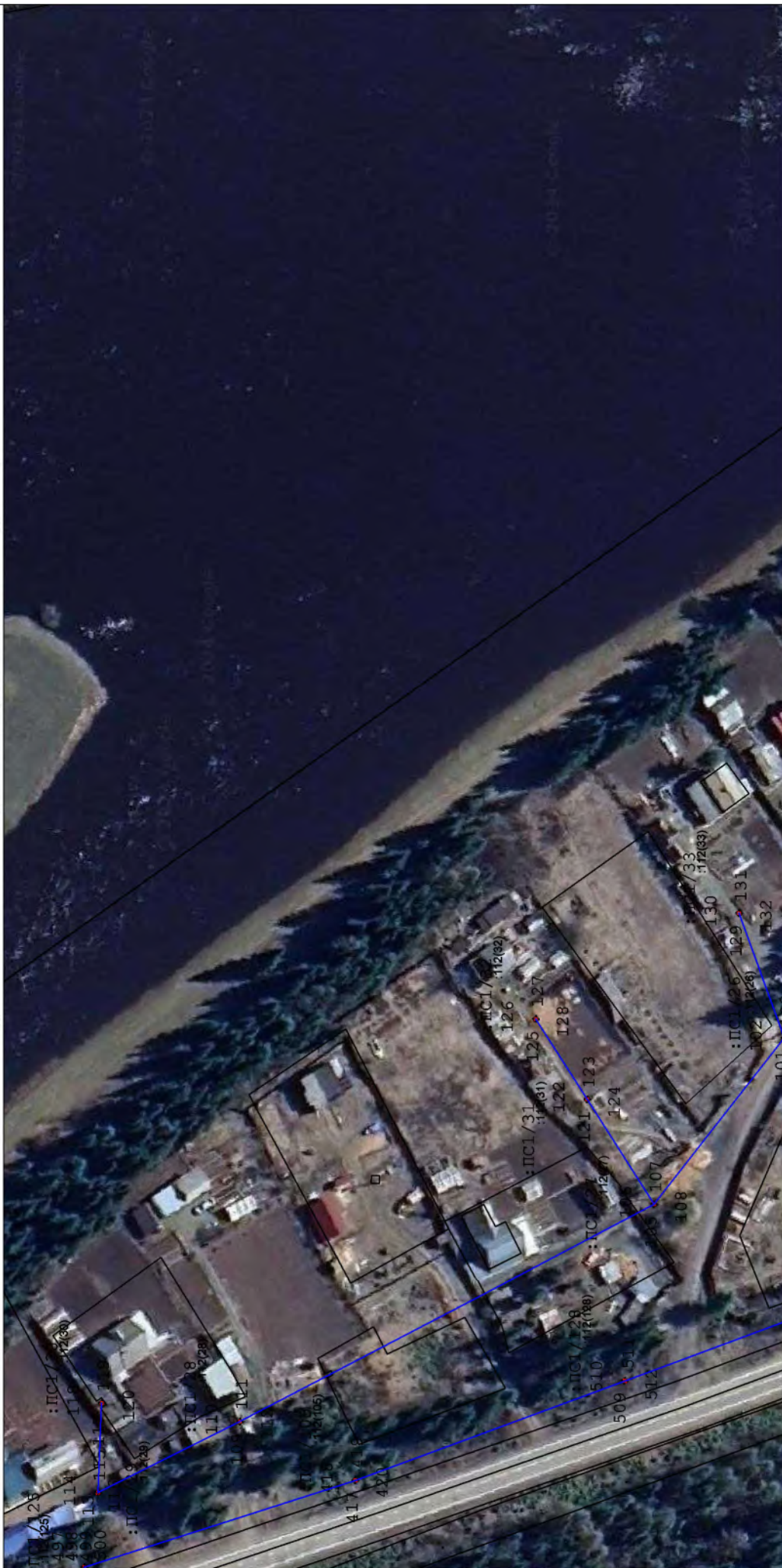
Масштаб. 1 : 1000