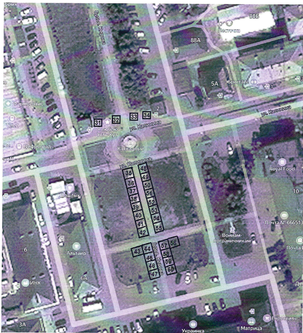
СХЕМА РАЗМЕЩЕНИЯ МЕСТ ДЛЯ ПРОДАЖИ ТОВАРОВ, ОКАЗАНИЯ УСЛУГ НА УНИВЕРСАЛЬНОЙ ПРАЗДНИЧНОЙ ЯРМАРКЕ «ДЕНЬ ГОРОДА» НА БУЛЬВАРЕ КИРОВА

Условные обозначения: 31 - 60 – номера торговых мест