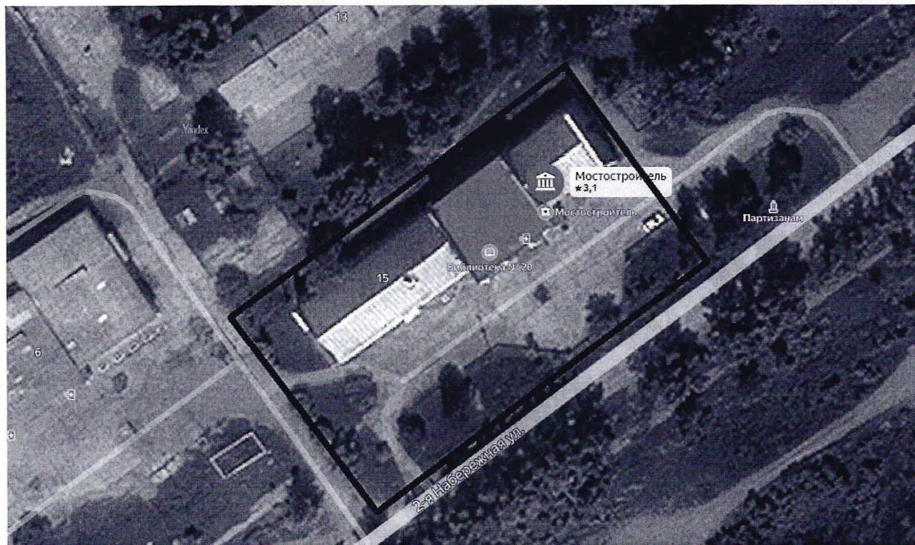
Схема границ территории проведения праздничного мероприятия на площади МКУК «Межпоселенческий КДЦ» УКМО (ДК «Мостостроитель»)

Условные обозначения: _____ граница праздничного мероприятия