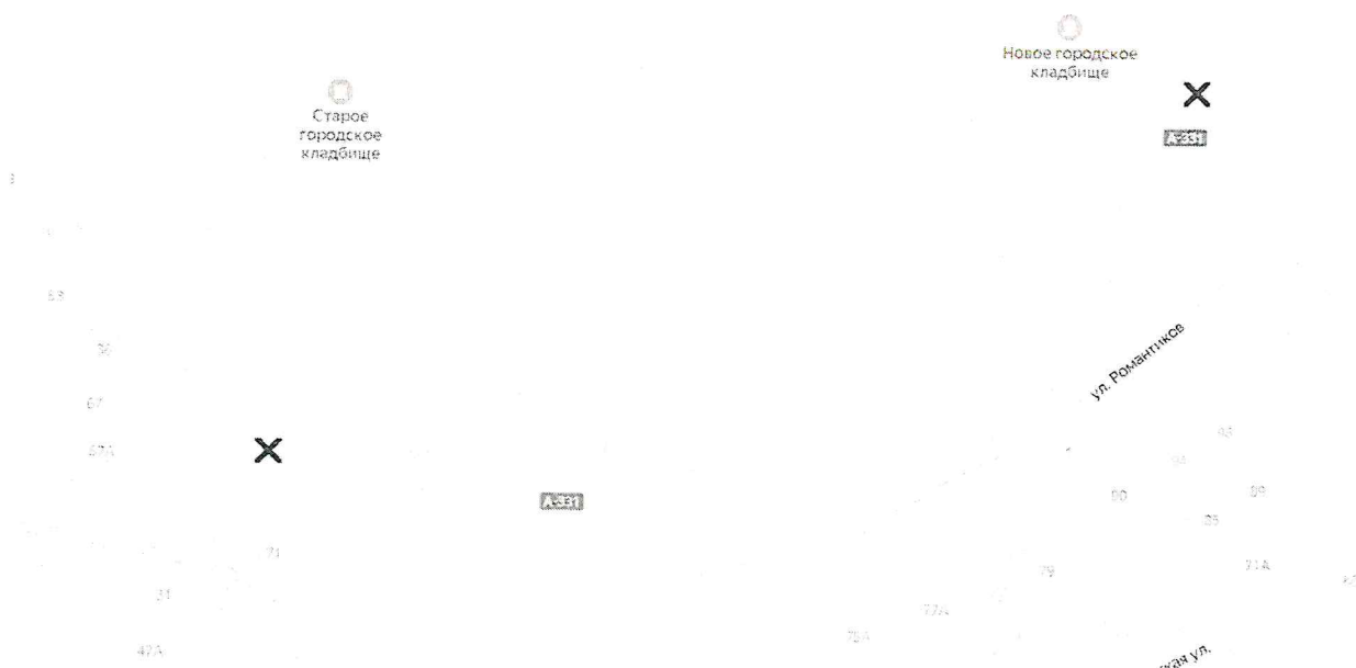
СХЕМА установки постов блокирования на примыканиях к территории городских кладбищ

Условные обозначения: X - посты блокирования дорожного движения.