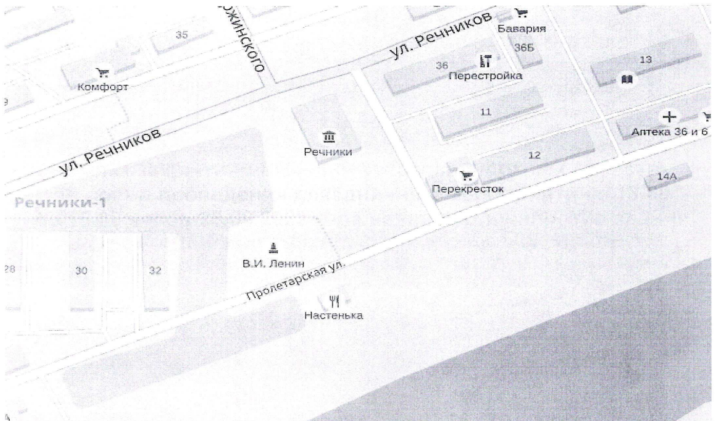
Схема закрытия движения автотранспортных средств во время проведения праздничных мероприятий с 13-00 до 15-00 часов 25.09.2022 года на площади напротив здания МБУК «ДК Речники» УКМО (гп) в городе Усть-Куте

Примечание: – места закрытия движения автотранспорта