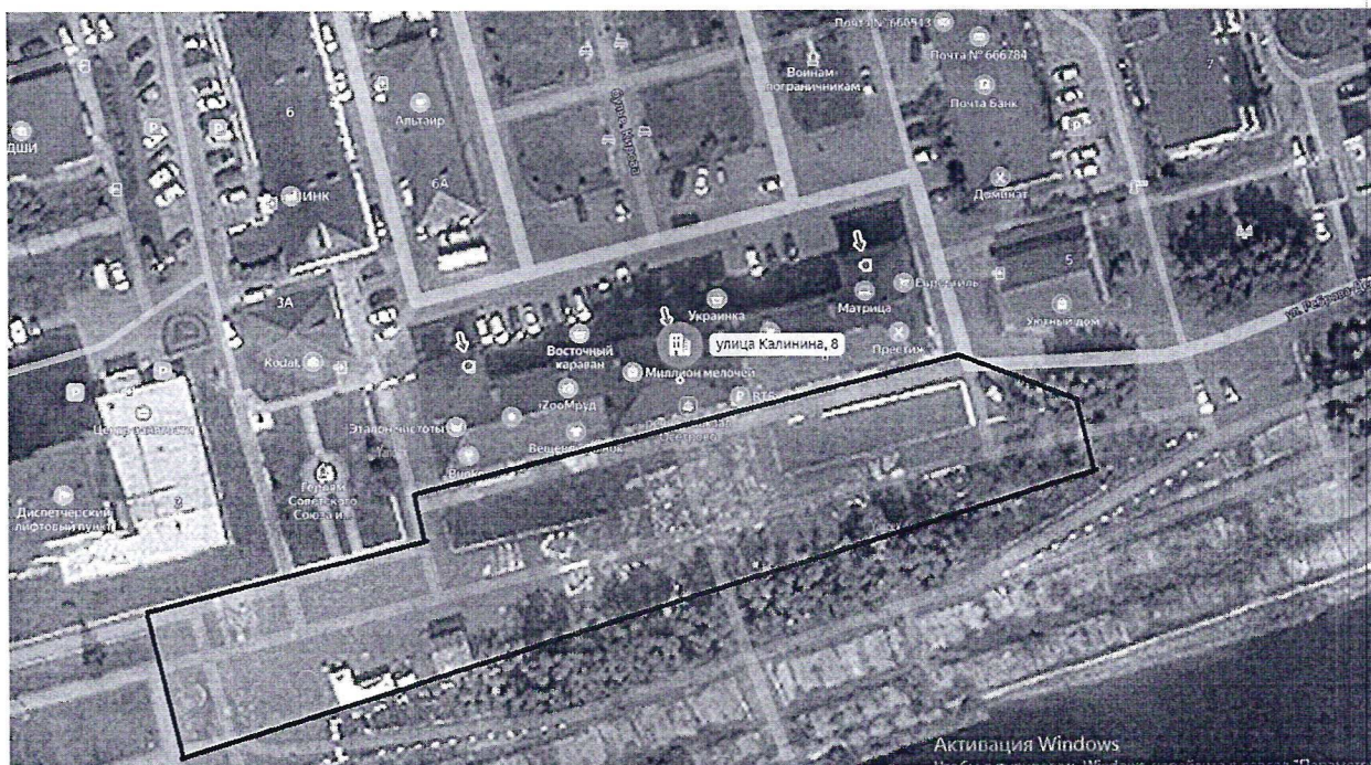
Схема границ территории проведения мероприятия на площади Речного вокзала