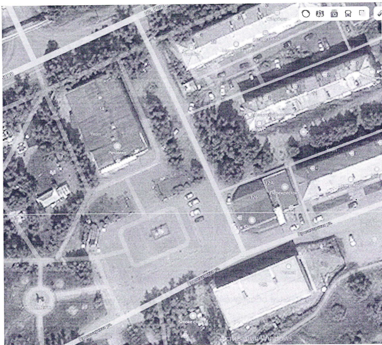
Схема Схема закрытия движения автотранспортных средств во время проведения праздничных мероприятий с 19.00 до 22.00 часов 06.07.2024 года на площади напротив здания МБУК «ДК Речники» УКМО (гп) в городе Усть-Куте

Примечание: – места закрытия движения автотранспорта