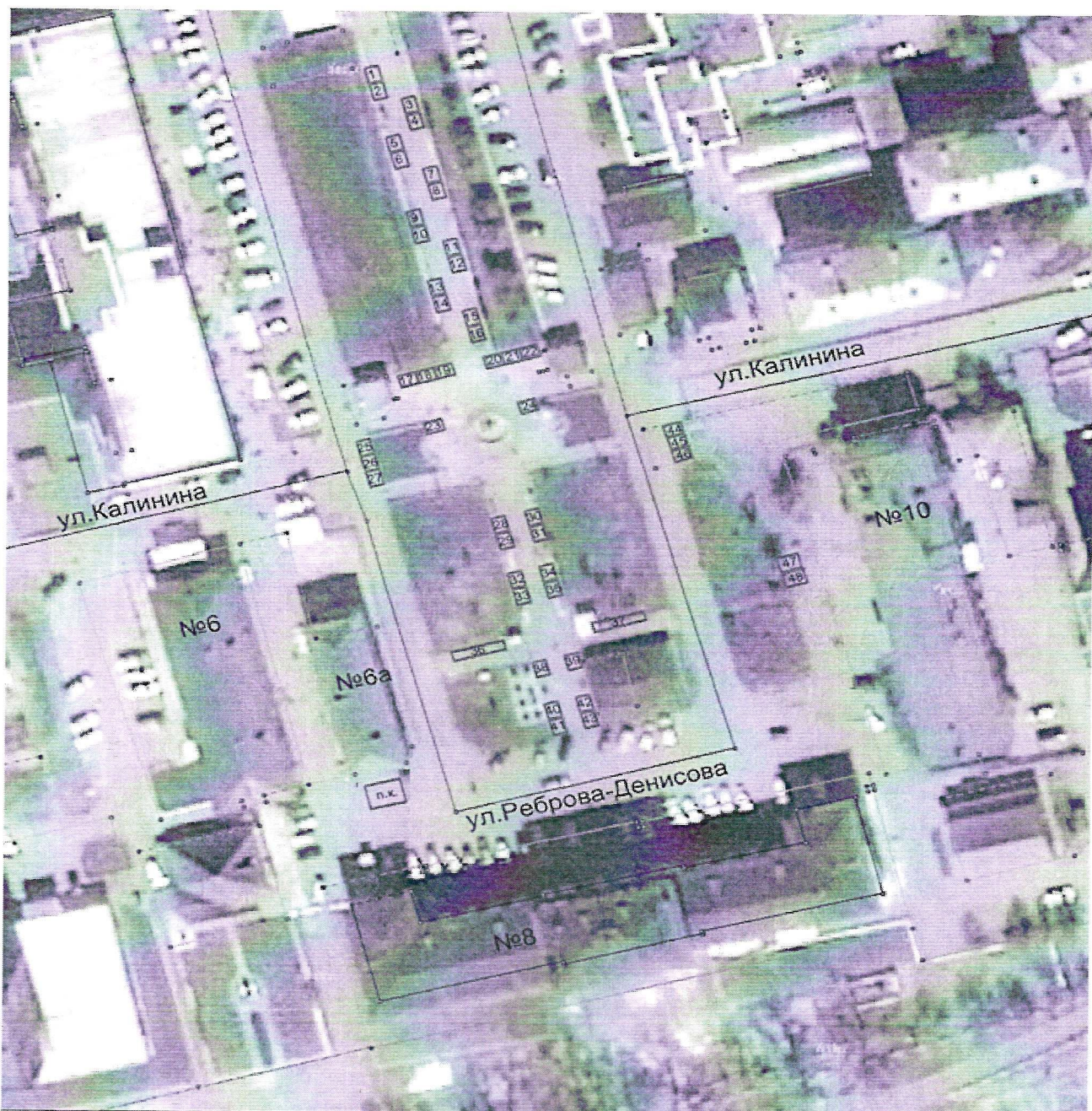
СХЕМА РАЗМЕЩЕНИЯ МЕСТ ДЛЯ ПРОДАЖИ ТОВАРОВ, ОКАЗАНИЯ УСЛУГ НА УНИВЕРСАЛЬНОЙ ПРАЗДНИЧНОЙ ЯРМАРКЕ «ДЕНЬ ПОБЕДЫ – 9 МАЯ!»

Приложение №4 к постановлению администрации Усть-Кутского муниципального образования (городского поселения) от « 20 » апреля 2023г. № 983-п