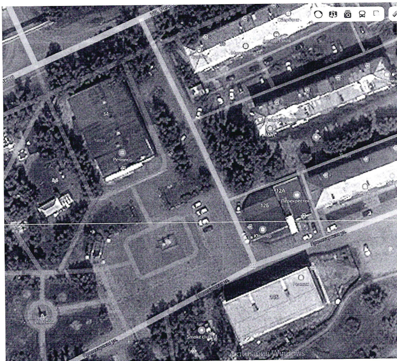
Схема закрытия движения автотранспортных средств во время проведения праздничных мероприятий с 19-00 до 21-00 часов 12.06.2022 года на площади напротив здания МБУК «ДК Речники» УКМО (гп) в городе Усть-Куте

Примечание: — места закрытия движения автотранспорта